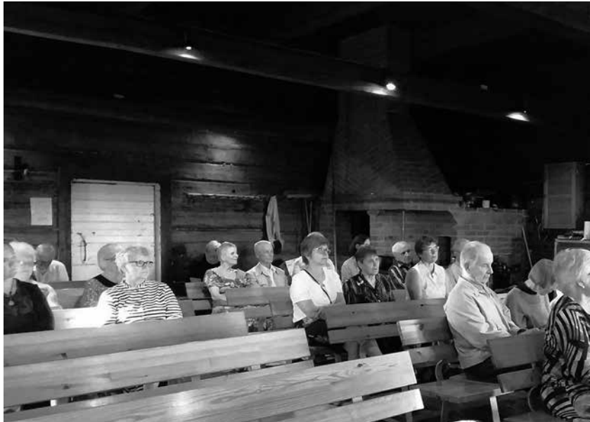
Riitan tuvan seuroissa.

seurojen sekä tilaisuuksien järjestämiseen. Tulevana kesänä pidämme jälleen seuratuvalta seuroja toukokuusta syyskuuhun kerran kuussa.