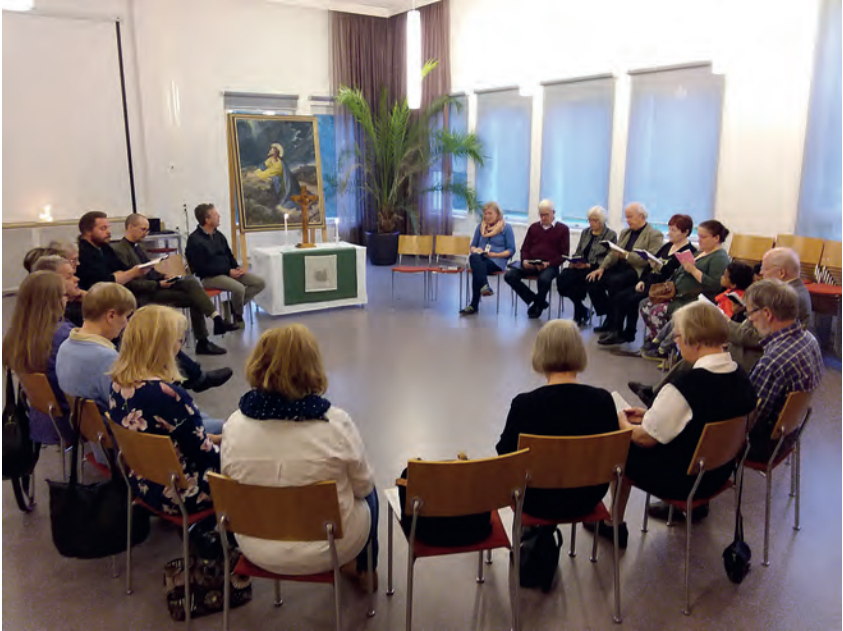
19.9.2018 pidettiin Jyväskylän kristillisellä opistolla hallituksen ja valtuuskunnan järjestämät siioninvirsiseurat.