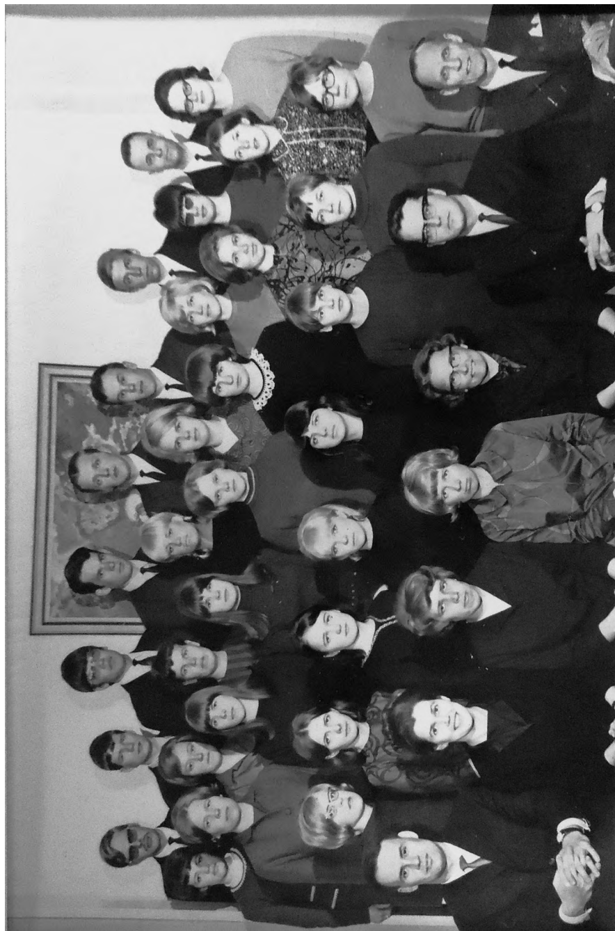
Jyväskylän kristillisen opiston kansankorkeakoululinja 1967 - 68.