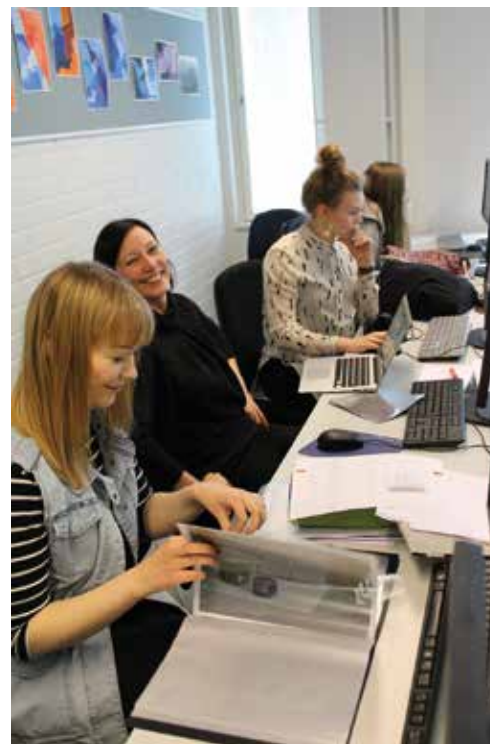
Opistoelämää kuluvalta opintovuodelta: Vasemmalla opinto- ja graafisen viestinnän luokassa.

Tervetuloa kaikki opiston entiset ja nykyiset opiskelijat sekä opiston ystävät.