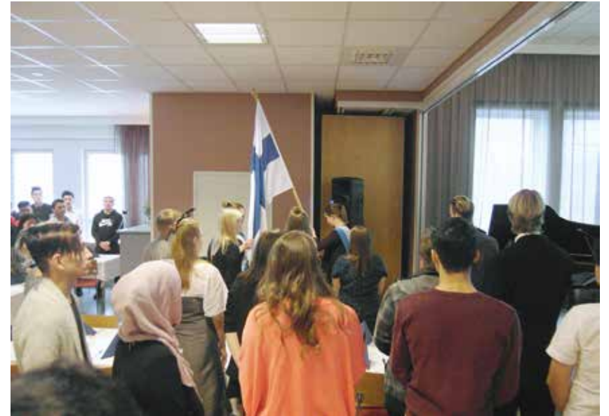
Opiston 75-vuotisjuhlaa vietettiin opistolla 28.11.2018.

Tällaisen oppilaitoksen rehtorilla on oltava selkeä näkemys tehtävästään ja hänen on uskottava itseensä johtajana. Muutosjohtajuus, jota minun rehtorikauteni oli, oli suurelta osaltaan ongelmien käsittelyä.