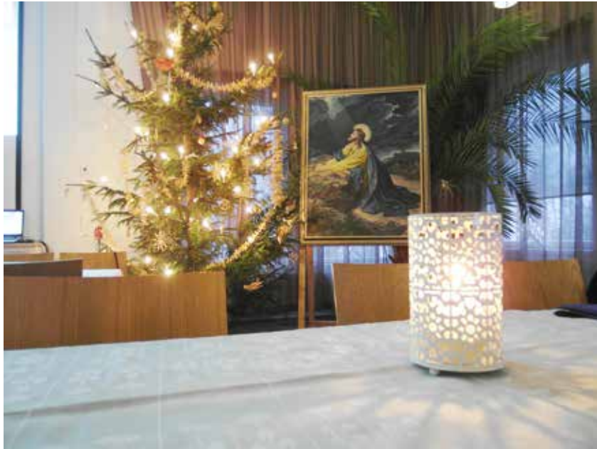
Opiston 75-vuotisjuhlaa vietettiin joulun alla.

Se taas vaatii stressinsietokykyä, itsehillintää ja sitä että rehtori on riittävän itsenäinen organisaatiossa. Rehtorin tehtävänä on johtaa ja ellei hän hoida tehtävää, joku toinen ottaa johtajuuden haltuunsa.